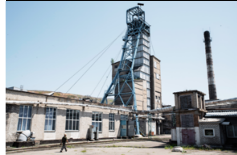
Sowjeterbe Am Rand der Kleinstadt Perschotrawensk liegt die seit 1970 betriebene Mine. Teile der Infrastruktur stammen noch aus der Sowjetzeit